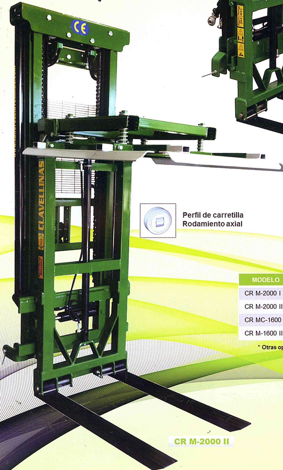
CR M-2000 II