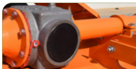
Grupo reforzado fundición.