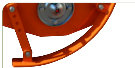
Patín regulable en altura.