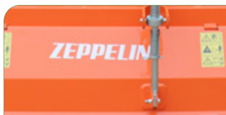
Portón ajustable con amortiguador.