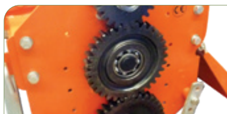
Transmisión por engranajes.