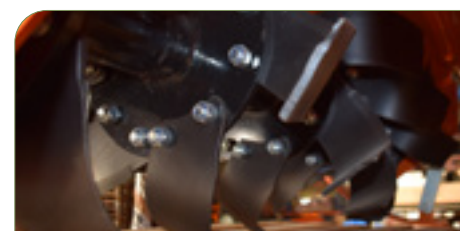
Detalle grupo cuchillas.